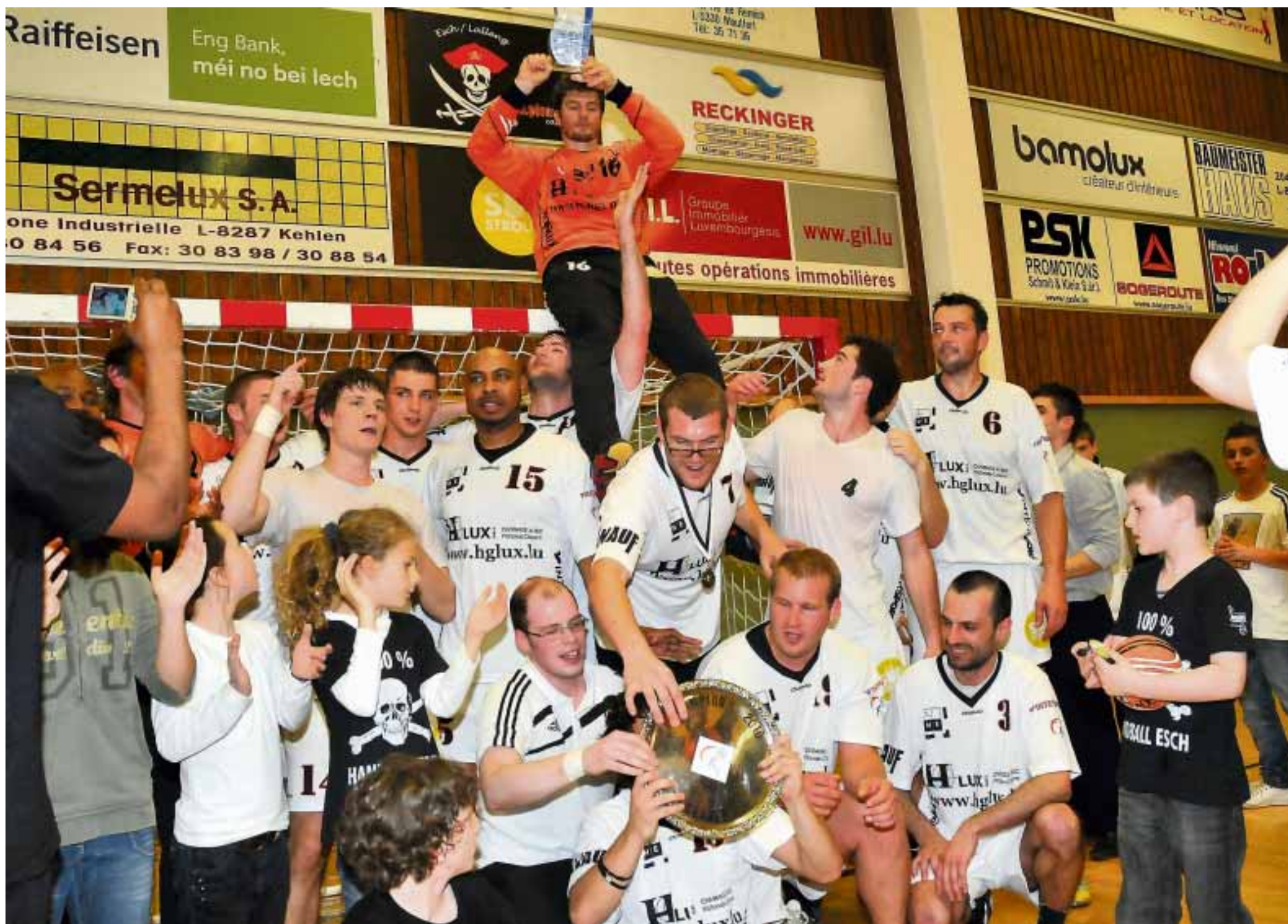
Dank der konstantesten Leistung steht der HB Esch am Ende der Saison 2009/10 verdient als neuer Landesmeister fest

Meisterschaft, letzter Spieltag der Sales-Lentz Handball League