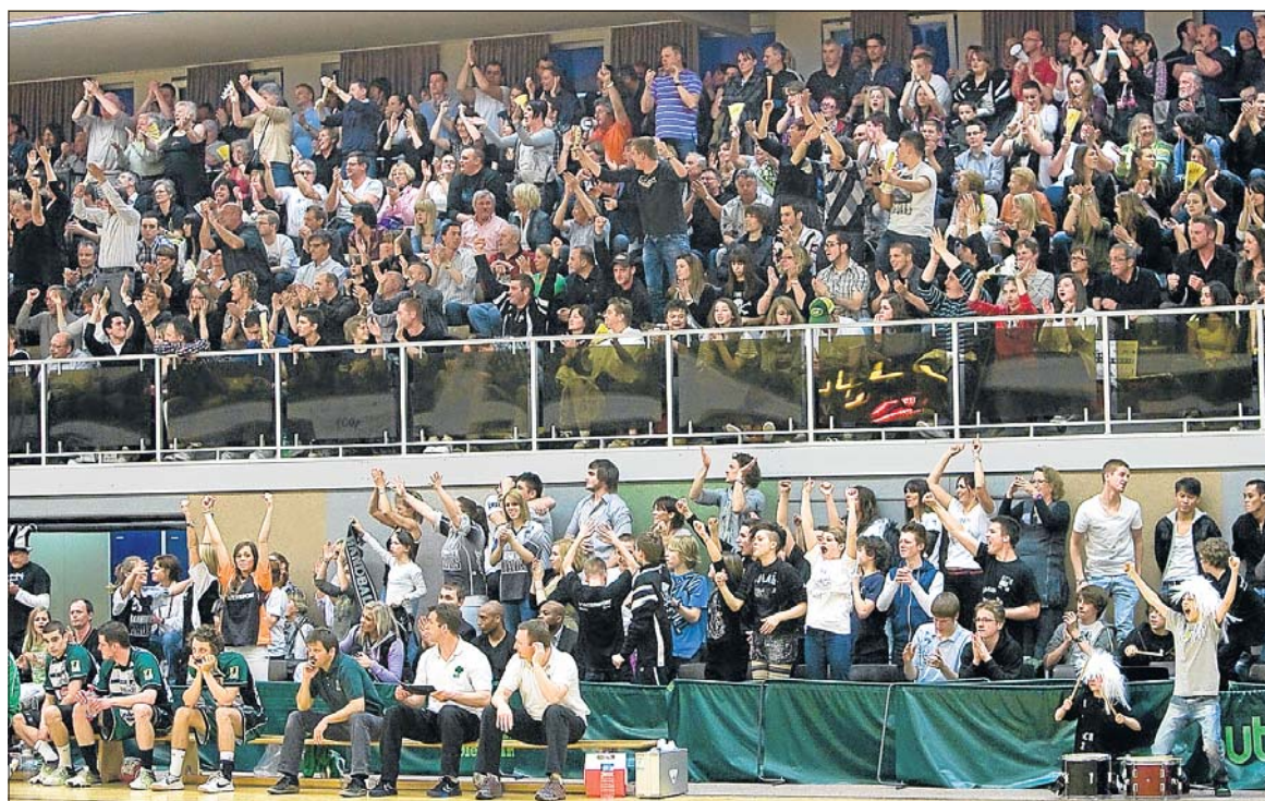
Rund 1 000 Zuschauer hatten sich für die entscheidende Begegnung in Esch eingefunden.