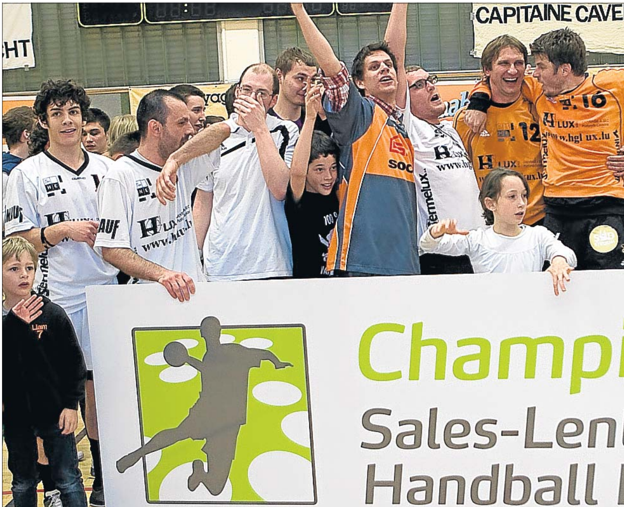
Mit einem souveränen Sieg im entscheidenden Spiel konnte sich HB Esch den Meistertitel sichern.

Berchem kann sein Potenzial über die gesamte Spieldauer