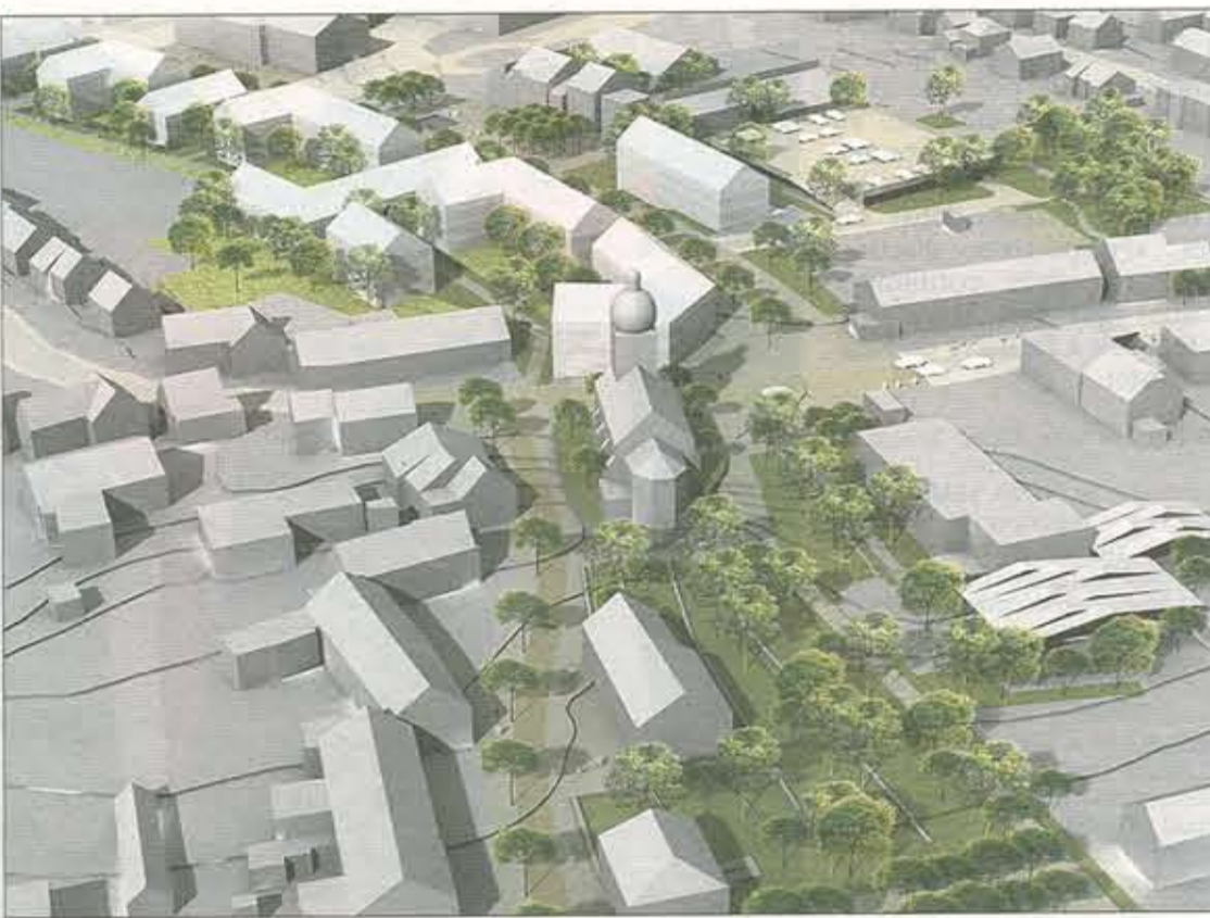
Vue globale du futur centre-ville de Mondcrange

Et de préciser que le futur plan directeur prévoit une structure mixte avec locaux commerciaux, bureaux et logements. Fernand Wagner a présenté le masterplan dans le détail. Pour le bureau d'architecte WW+ Architektur + Management sàrl, le projet vise une continuité avec celui en cours dans la rue de l'Eglise. Le futur quartier se présentera sous forme d'éventail comprenant des constructions à toiture en selle avec cours intérieures et 130 emplacements de stationnement, beaucoup de zones vertes, la transformation de l'actuel parking sur deux niveaux et une réserve en superficie pour un élargissement éventuel du complexe scolaire. Il s'entend que