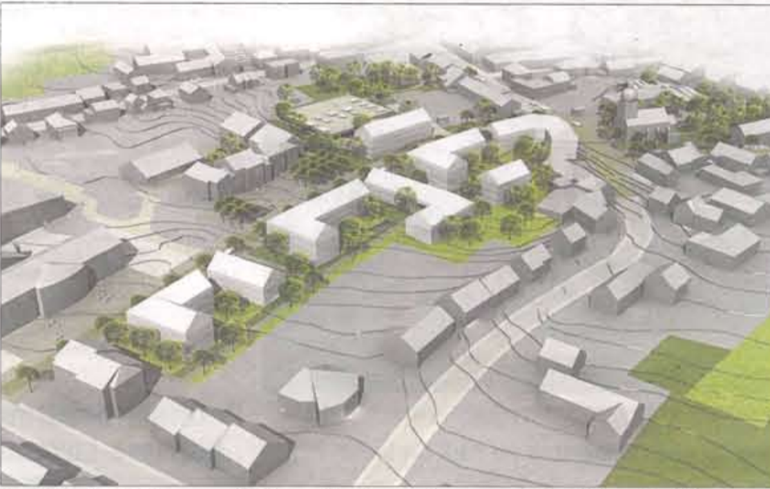
Monnerich im Modell: Der gesamte Dorfkern soll im Zuge der Planungen und Neudefinierung der Flächenmützung einwohnerfreundlicher gestaltet werden.

Auch soll der bestehende Parkplatz im Rahmen eines gemeindeeigenen sozialen Wohnbauprojektes reduziert werden. Zur Straßenfront möchte die Gemeindeverwaltung sozialen Wohnungsbau betreiben. Bürger, de-