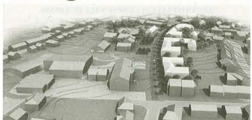
Das Modell zeigt die zukünftige Bebauung

Genehmigt wurde eine Konvention zur Bebauung von drei Grundstücken entlang der Europastraße in Steinbrücken. Auch setzt die Gemeinde Mon-