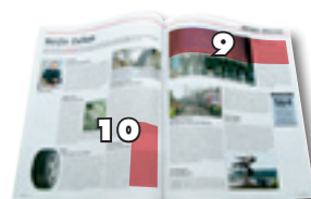
1/4 H 1/4 L