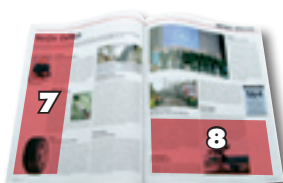
1/3 H 1/3 L