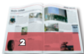
2x 1/2 page Panoramique